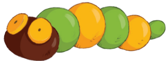
ein lustiger Wurm