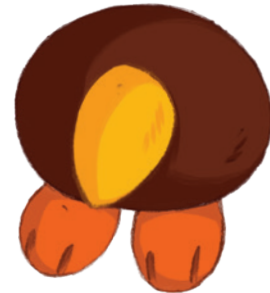
ein putziger Vogel