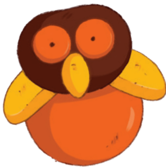
eine kleine Eule